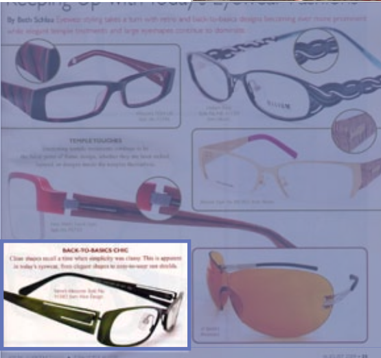
USA Vision Care product News Agosto 2009 pag. 35 VANNI - Meccano