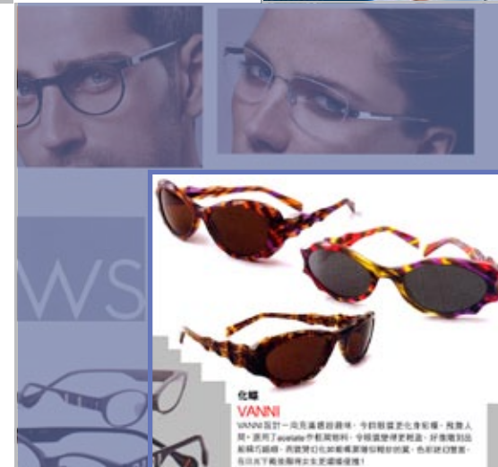
Hong Kong V Magazine Giugno 2009 pag. 115 VANNI - Chrysalis